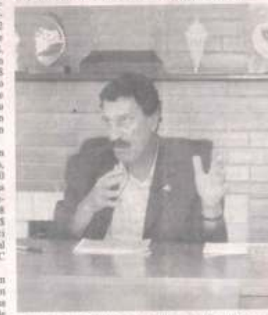
Bigucci em São Caetano e metro quadrado custa até R$ 4.200

atingindo a valor de até R$ 4.000 m², considerando que a cidade mais valorizada é São Caetano, custando até R$ 4.200 m², por causa da carência de terrenos. Mesmo assim, a procura por imóveis de tamanho médio, como os de 3 dormitórios, nas 3 regiões analisadas, está sempre em 1º lugar.