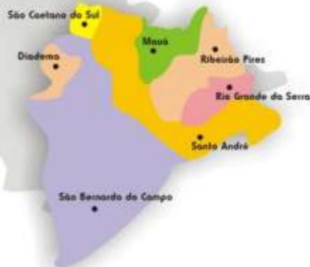
Região de atuação da ACIGABC

Rua Java, 239 - Jardim do Mar São Bernardo do Campo - SP (11) 4330-8911 / 4121-5335 acigabc@acigabc.com.br www.acigabc.com.br